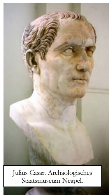
Julius Cäsar. Archäologisches Staatsmuseum Neapel.

Der patrizischen Familie der Julier entstammend, absolvierte er die Ämterlaufbahn und gelangte durch ein Bündnis mit dem reichen Marcus Licinius Crassus und dem erfolgreichen Militär Gnaeus Pompeius Magnus im Jahr 59 v. Chr. zum Konsulat. In den folgenden Jahren ging Caesar als Proconsul in die nördlichen Provinzen Illyrien und Gallia Cis- und Transalpina, von wo aus er in den Jahren 58–51 v. Chr. ganz Gallien bis zum Rhein eroberte. Im anschließenden römischen Bürgerkrieg (49–45 v. Chr.), in dem er sich gegen seinen ehemaligen Verbündeten Pompeius und dessen Anhänger durchsetzte,