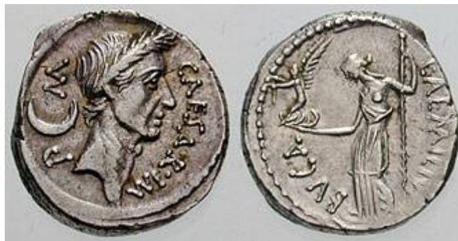
Caesar war der Erste, den man zu Lebzeiten auf römischen Münzen abbildete

Brutus, Cassius und die anderen Verschwörer, die eigentlich damit gerechnet hatten, als Befreier und Wiederhersteller der Republik gefeiert zu werden, mussten sich daher Anfang April fluchtartig aus Rom zurückziehen.