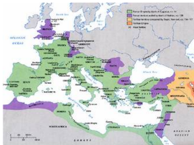
Karte des römischen Reiches unter Trajan

Zum Zeitpunkt seiner größten Ausdehnung, zu Zeiten des Kaiser Trajans, am Ende der Regierungszeit Hadrians, erstreckte sich das Römische Reich auf drei Kontinente. Es umfasst die Gebiete rund um das Mittelmeer, Gallien und große Teile Britanniens sowie die Gebiete rund ums Schwarze Meer. Der Handel, die Künste und die Kultur erreichten während der Zeit des Römischen Reiches in Teilen seines Gebietes eine erste Hochblüte, die damalige Lebensqualität und der entsprechende Bevölkerungsstand sollten in Europa und Nordafrika erst Jahrhunderte später wieder erreicht werden