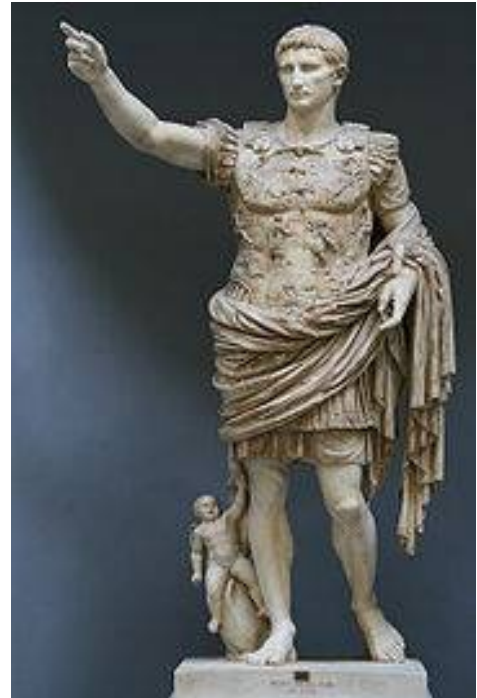
Der erste römische Kaiser, Augustus

Die Gründung Roms begann eigentlich mit der Besiedelung der Hügel Palatin, Quirinal, Viminal und Esquilin, auf dem die spätere Stadt Rom entstand. Die Hügel wurden am Anfang von Latinern und Sabinern bewohnt. Der Legende nach wurde 753 v. Chr., die Stadt Rom von den Gebrüder Romulus und Remulus gegründet. Die beiden stritten sich über die Herrschaft und Remulus wurde dabei getötet. So wurde Romulus (753 v.Chr.-715 v.Chr.) der erste römische König. 715 v.Chr. übernahm Numa Pompilius die Macht. Tullus Hostilius (673-641 v.Chr.) hieß der dritte König.